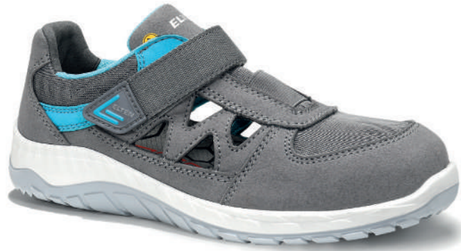
MADDIE grey Easy/Low ESD S1PS EN ISO 20345 S1PS FO/SR