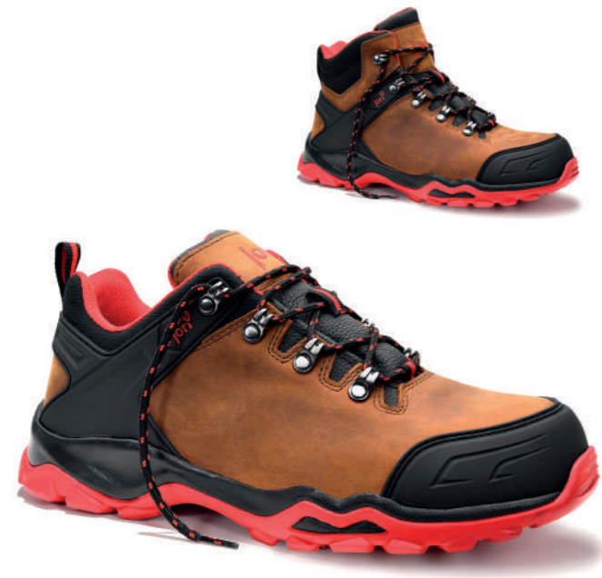
jo_POWERFUL brown Low/Mid S3S3 EN ISO 20345 S3S FO/SR/SC/HRO