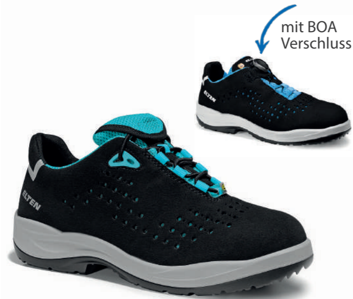
IMPULSE Lady aqua Low/BOA® ESD S1PS EN ISO 20345 S1PS FO/SR

Art.-Nr. 746102 | Farbe Schwarz-Blau Hoher Schaft | Größen 34-42 87,90 €