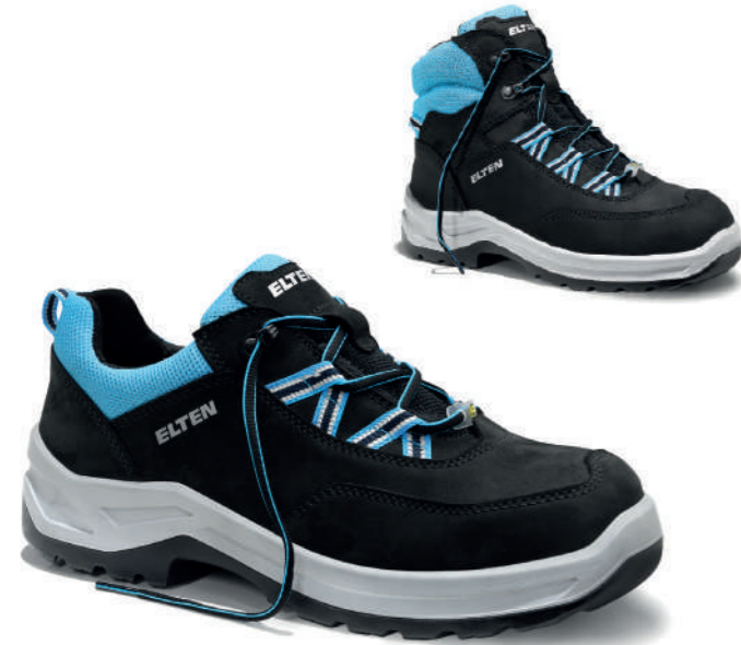
LOTTE aqua Low/Mid ESD S2 EN ISO 20345 S2 FO/SR