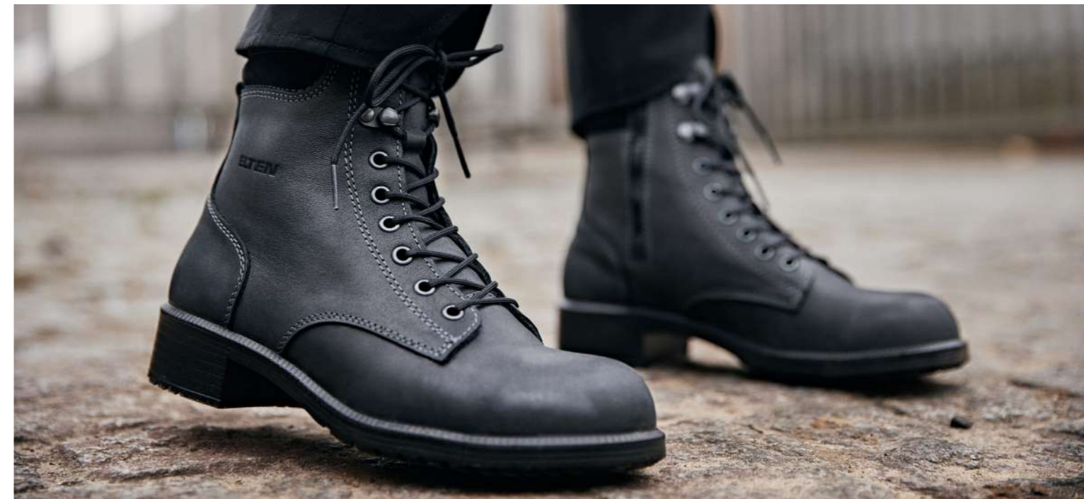
NIKOLA black Mid ESD S2 EN ISO 20345 S2 FO/SR

Art.-Nr. 74831 | Farbe Schwarz-Blau BOA-Verschluss | Größen 35-42 88,90 €