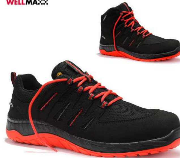
MADDOX Compo black-red Low/Mid ESD S3S EN ISO 20345 S3S FO/SR