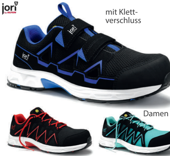
jo_SPEEDY black-blue Easy/red/aqua ESD S1PS EN ISO 20345 S1PS FO/SR/SC/HRO