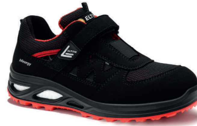
HANNAH XXTL black-red Easy ESD S1PS EN ISO 20345 S1PS FO/SR