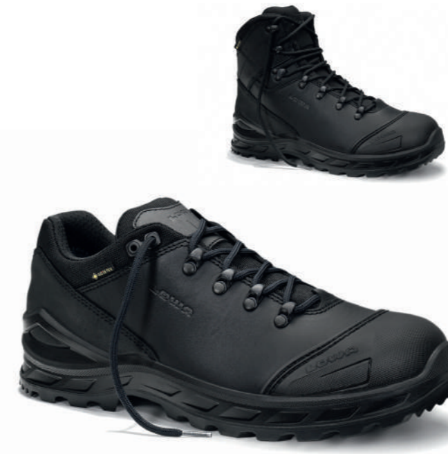
LOWA LEANDRO Work LX Pro GTX S3S CI EN ISO 20345 S3S WR/FO/HI/HRO/CI