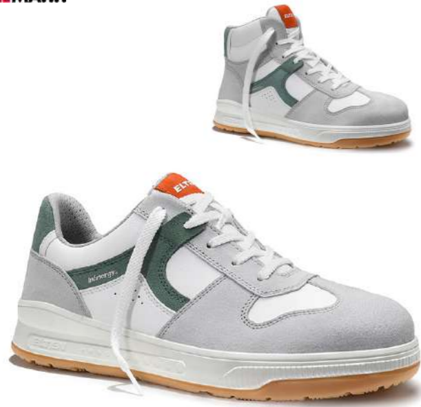
ROSARIO XXST white-green Low/Mid ESD S1PS EN ISO 20345 S1PS FO/SR