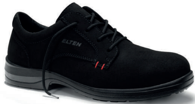
BROKER XXB black Low ESD S1/S1PS EN ISO 20345 S1/S1PS FO/SR