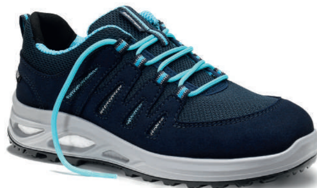
MADDIE XXTL blue Low ESD S3S EN ISO 20345 S3S FO/SR