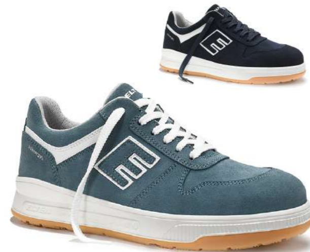
JAMAIN XXST jeans/blue Low ESD S2/S3S EN ISO 20345 S3S FO/SR/HRO