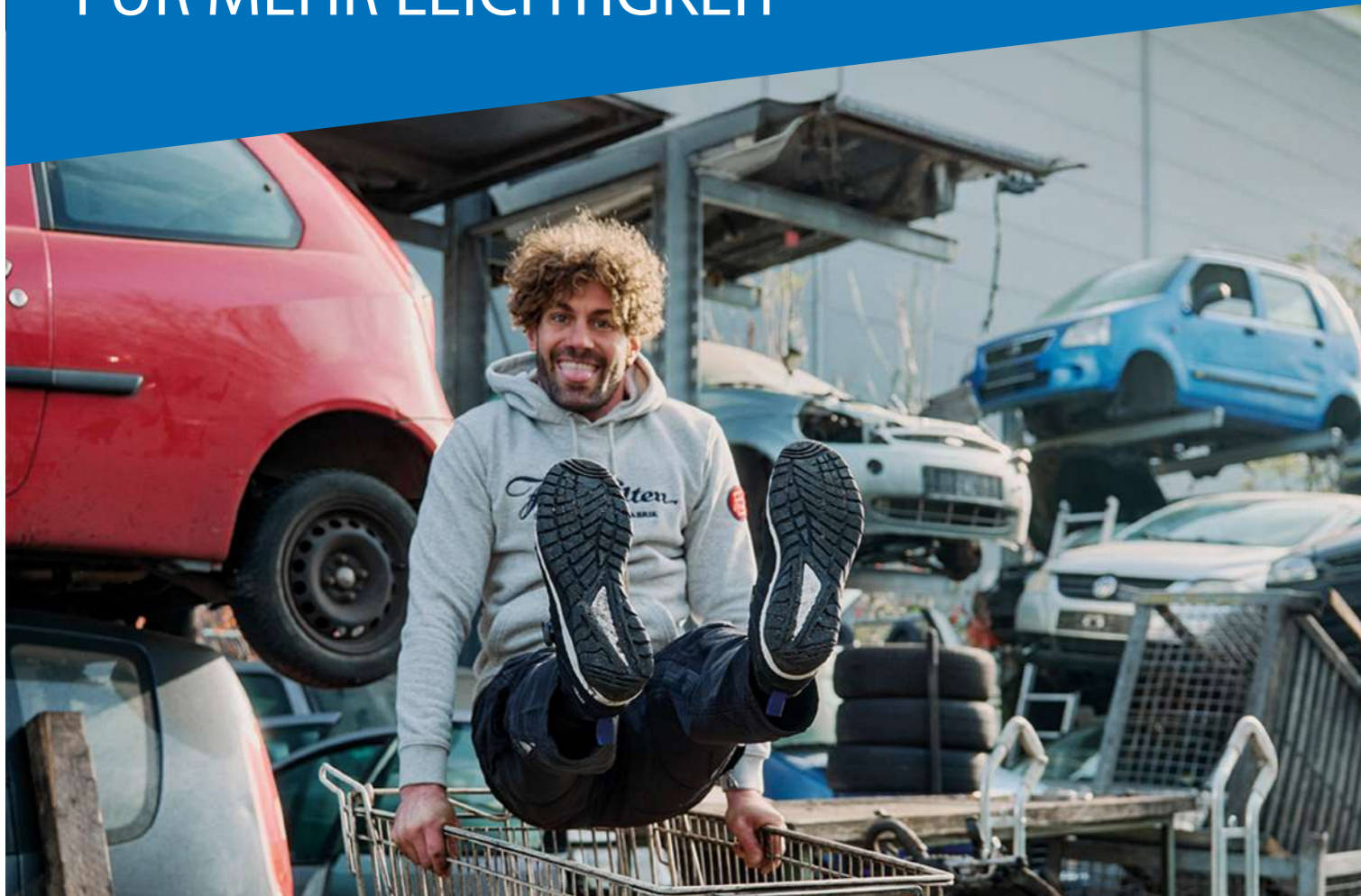
MADDOX Compo BOA® black-grey/red Low ESD S3S EN ISO 20345 S3S FO/SR