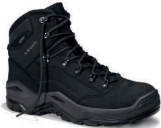
LOWA RENEGADE Work GTX S3S CI EN ISO 20345 S3S WR/FO/HI/HRO/CI