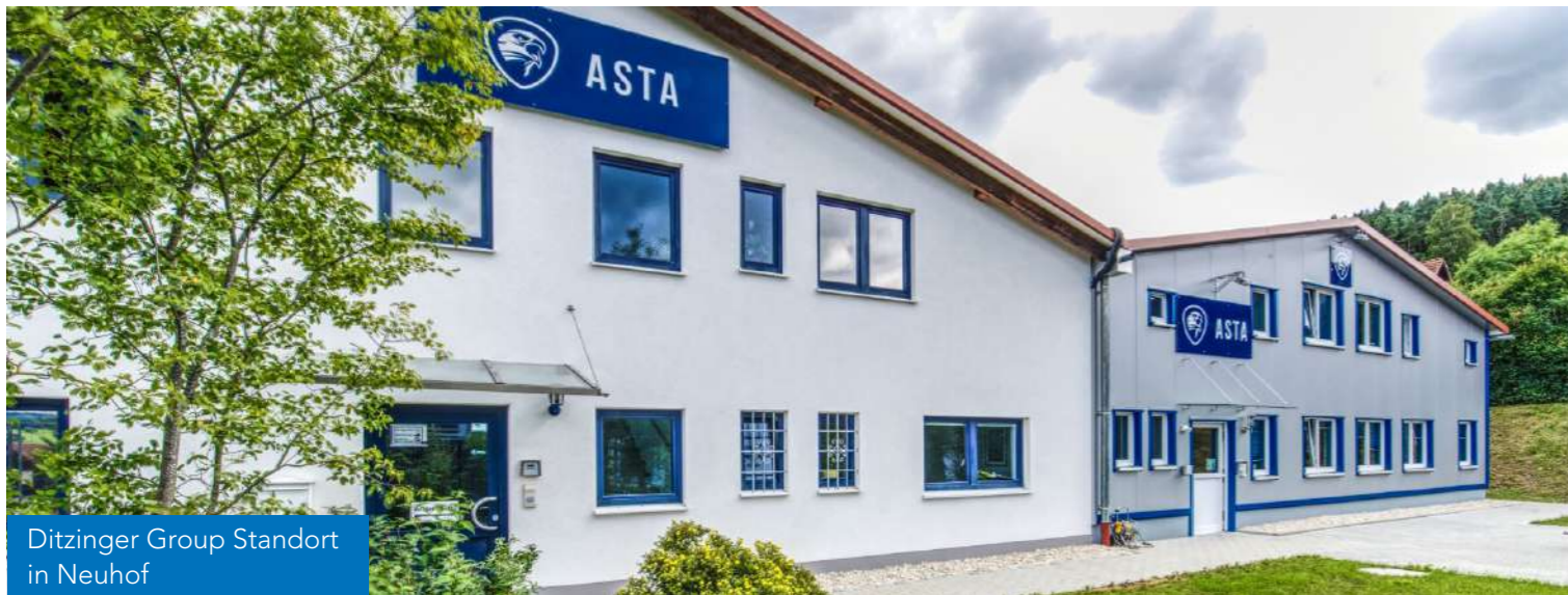
Ditzinger Group Standort in Neuhof