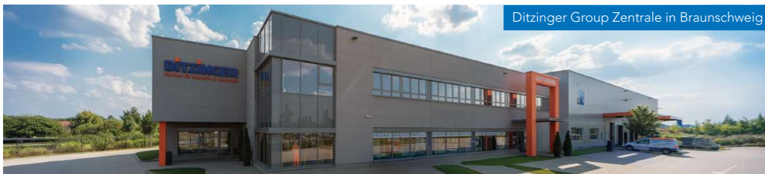
Ditzinger Group Zentrale in Braunschweig

Damit wir planen können, bitten wir Sie um Ihre kurze Anmeldung: