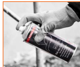
CHEMISCH- TECHNISCHE PRODUKTE