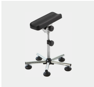
Beinstütze mit Gleitern