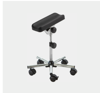
Beinstütze mit Rollen