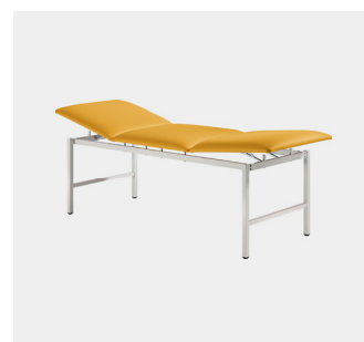
Alterna 65 cm breit Alterna 80 cm breit