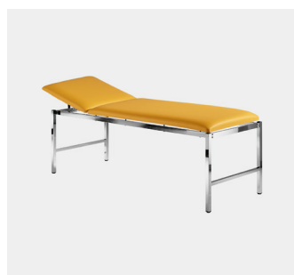
Classic 65 cm breit Classic 80 cm breit

Auszug aus unserem Jubiläumskatalog 2022