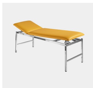
Siesta 65 cm breit Siesta 80 cm breit