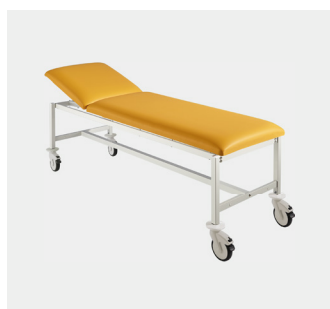
Classic Mobil 65 cm breit Classic Mobil 80 cm breit