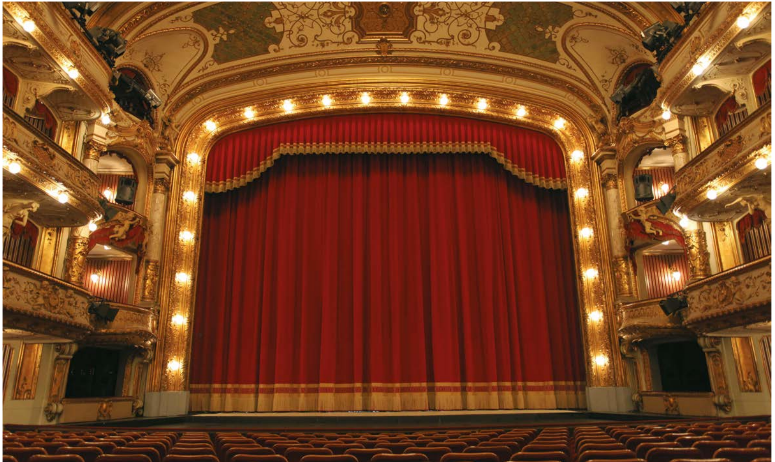
Croatian National Theatre, Zagreb – Croatia / Main Curtain: made in two pieces from ALICANTE stage velour, color wine red, with ECLIPSE lining and hand-crafted 75 cm high fringe. Size each part: 6.50 m wide x 10.84 m high (+50 % fullness).